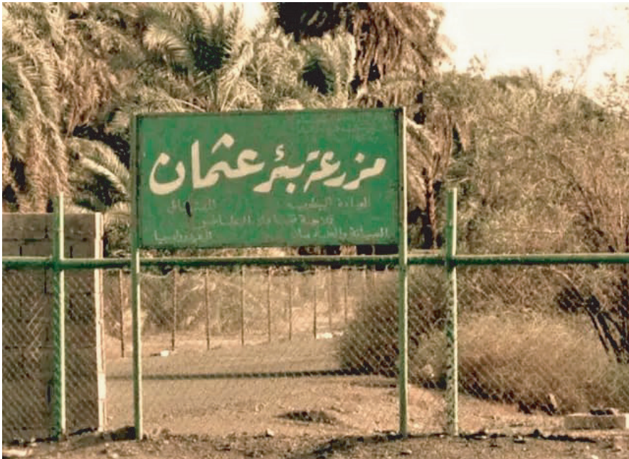
وقف عثمان بن عفان